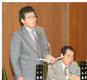
牧山 隆 議員

牧山隆議員は、国保税の引き下げと資格証明書の発行は、廃止することなどを求めて一般質問を行いました。